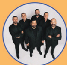
NERI PER CASO