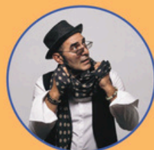
FRANCESCO BACCINI Duo

dal 23 al 25 LUGLIO Rive d'Autore - II Edizione