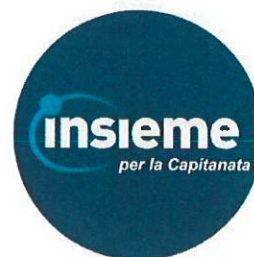
Figura circolare blu, al centro la scritta “INSIEME”, in stampatello con carattere grande di colore bianco racchiusa parzialmente con un semicerchio aperto verso l’esterno di colore azzurro con punto sovrascritto sulla lettera “I” e la scritta laterale in stampatello con carattere piccolo di colore bianco “per la Capitanata”.