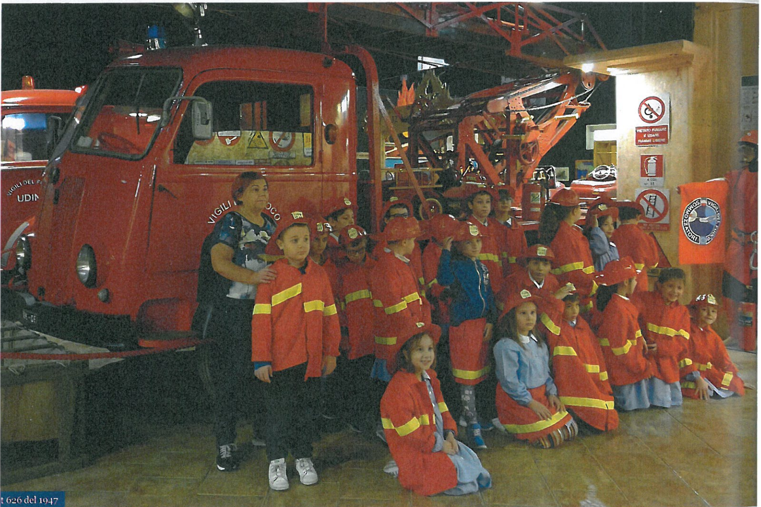
Autocarro t. 626 del 1947