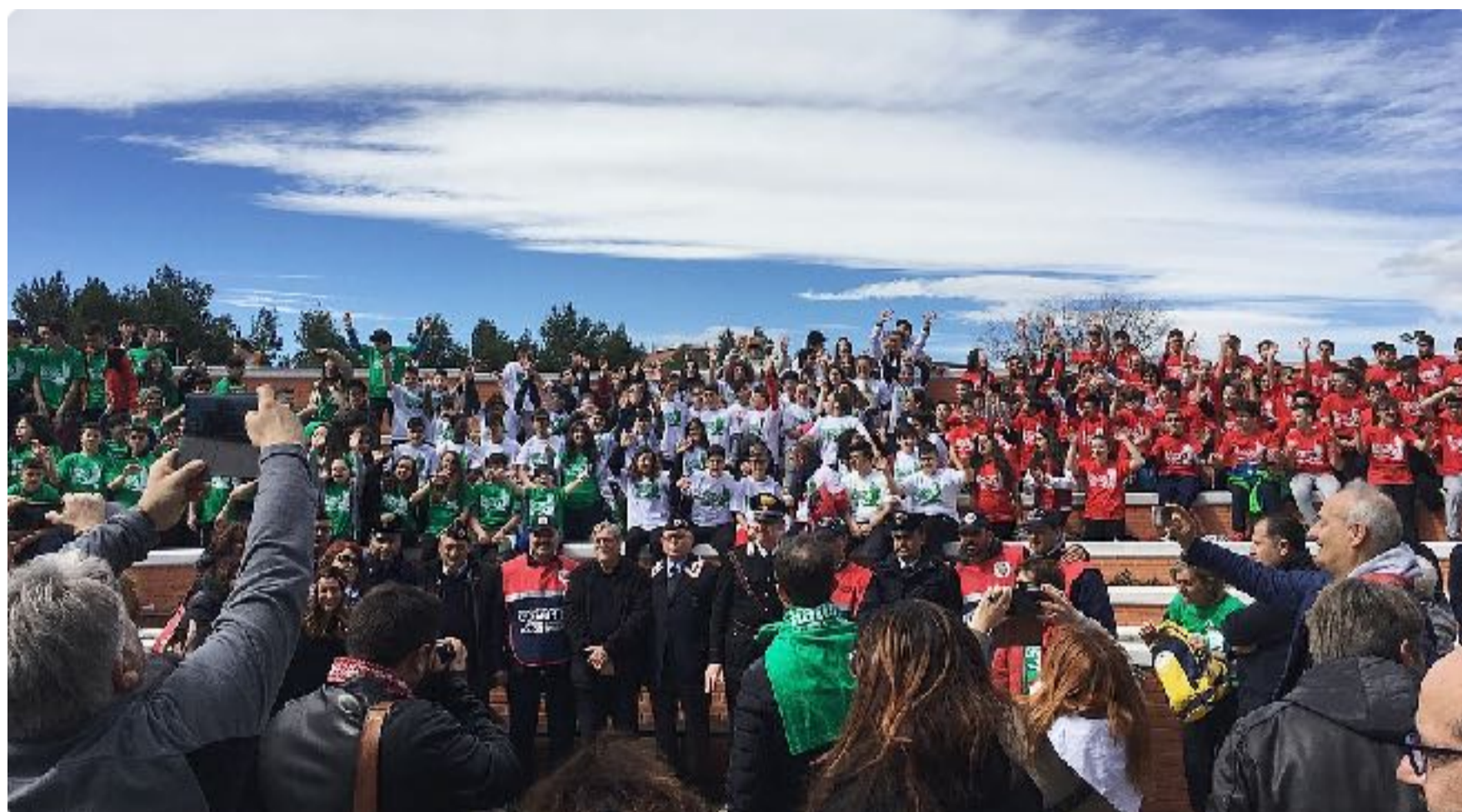
Manifestazione "Libera la natura", 19 marzo 2018

Abbiamo avuto l'onore di accogliere in questi anni ospiti speciali: