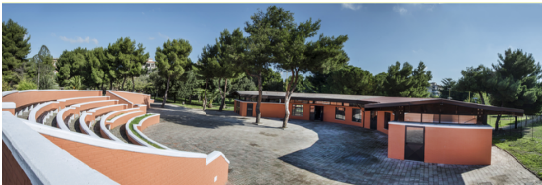
Struttura riqualificata, ottobre 2016

Graduatoria approvata in data 20 febbraio 2014. Convenzione firmata in data 28 aprile 2015. Promosso da: Associazione Temporanea di Scopo, costituita in data 3 luglio 2014 presso Comune di Foggia, proprietario del bene pubblico oggetto dell'intervento, composta da: Associazione di promozione sociale "Energiovane" (Capofila), Associazione di Volontariato "L'Aquilone", Cooperativa sociale a r.l. Monti Dauni Multiservice – Onlus, Fondazione Apulia Felix Onlus.