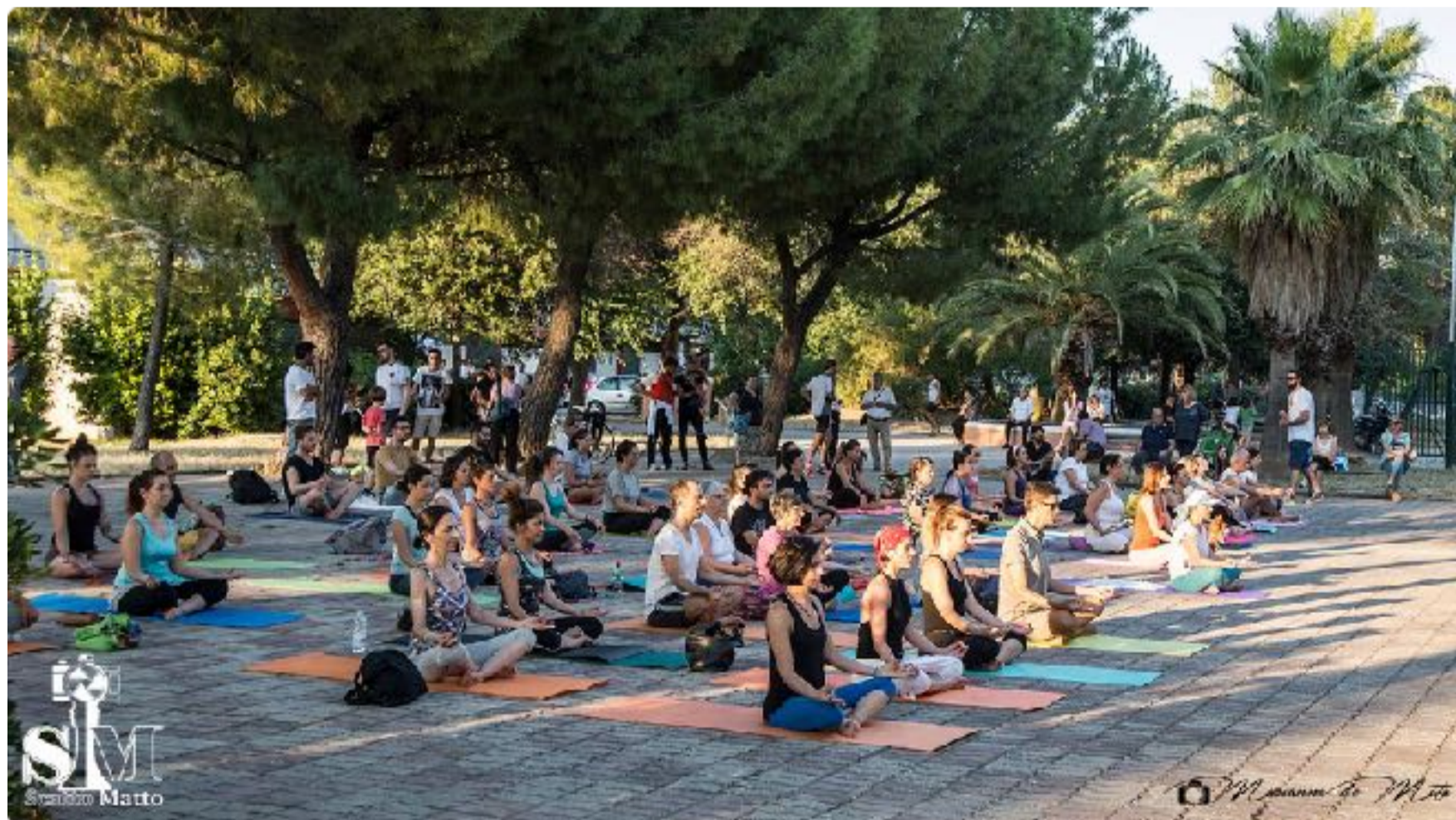
Giornata interazione dello Yoga - Parco San Felice