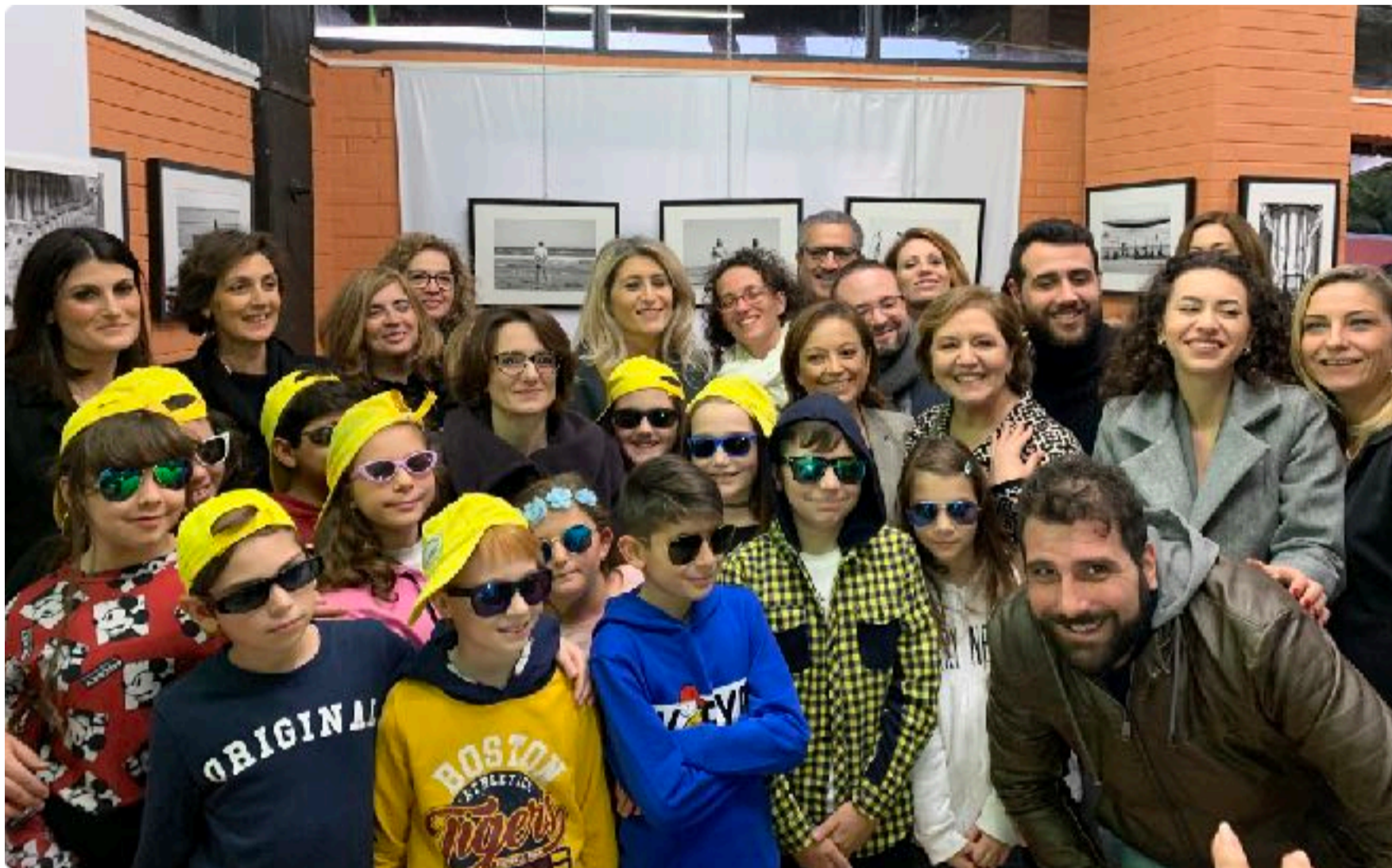
Visita della Ministra per le Pari Opportunità e la Famiglia Elena Bonetti, 16 dicembre 2019