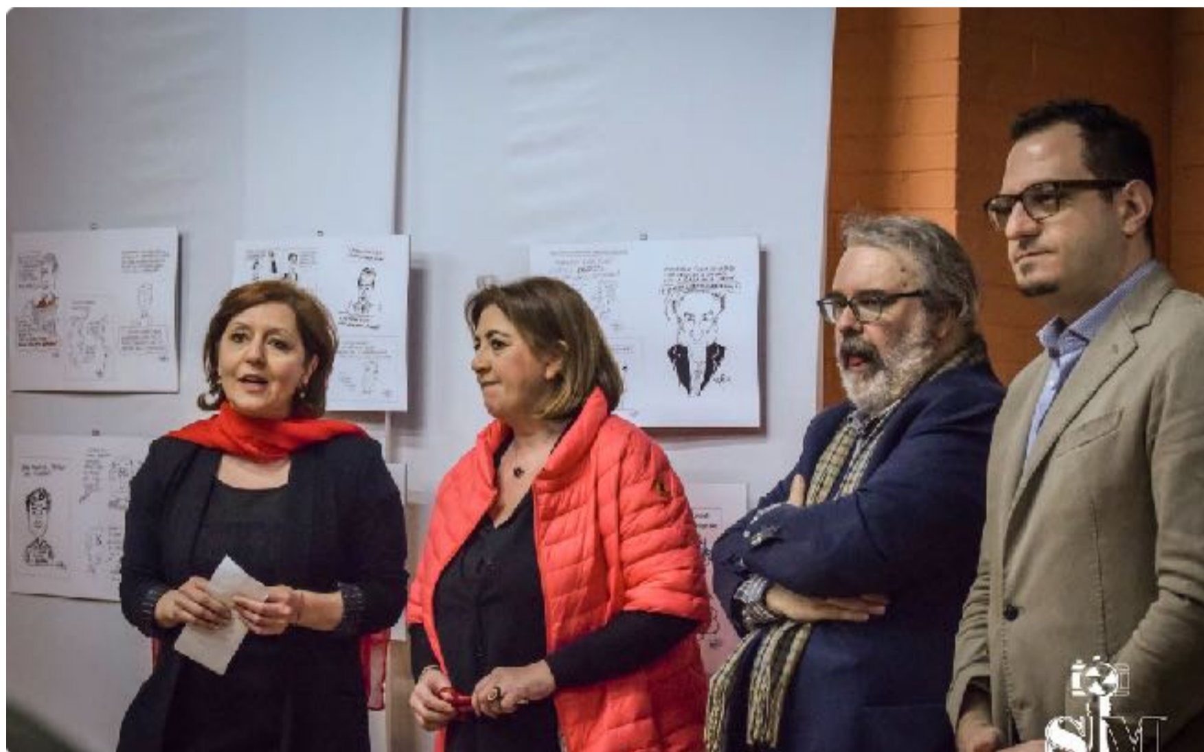
Inaugurazione di una mostra di vignette satiriche, 25 marzo 2017

La nascita di una sala che espone “la bellezza” in un luogo dove prima abitava il brutto è tra i risultati che ci rende molto orgogliosi.