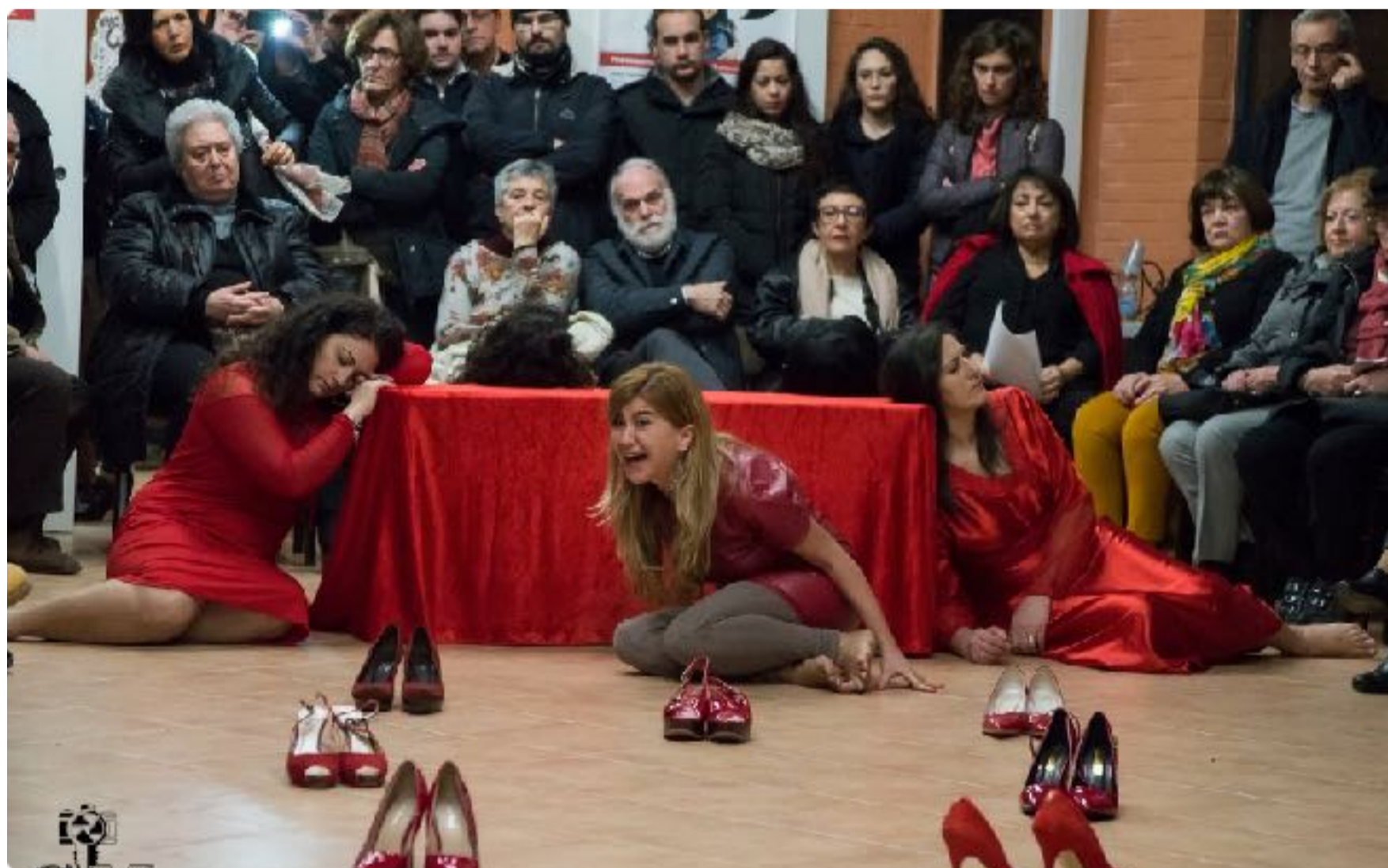
Performance teatrale “Scarpette rosse” messa in scena in occasione della Giornata internazionale per l’eliminazione della violenza sulle donne, 25 novembre 2016

e gestione. Sin dal primo anno abbiamo istituito un evento che ha riscosso notevole attenzione da parte dell'opinione pubblica “La Settimana dei Diritti” che nel 2019 ha raggiunto la sua terza edizione. Il senso della settimana dei diritti è quello di formare le giovani generazioni ad una cultura che superi gli stereotipi di genere, causa principale di violenze e sopraffazione delle donne da parte degli uomini. La Settimana dei Diritti quindi è orientata a rivalutare i percorsi formativi e didattici promuovendo la prevenzione degli stereotipi di genere attraverso un'educazione alla differenza lungo tutto il percorso scolastico e formativo affinché la cultura che tenga conto delle differenze sia un valore aggiunto alle relazioni tra uomini e donne. La settimana parte ogni anno dal 20 novembre (Giornata internazionale dei Diritti dell'infanzia e dell'adolescenza – la data ricorda il giorno in cui l'Assemblea generale delle Nazioni unite adottò nel 1989 la Convenzione Onu sui diritti dell'infanzia e dell'adolescenza), al 25 novembre, e cioè la data in cui ricorre la Giornata mondiale contro la violenza sulle donne. L'ultima organizzata nel 2019 ha visto protagonisti i diritti dell'infanzia e dell'adolescenza il 20 novembre con laboratori con le scolaresche e con la biblioteca La Magna Capitana, si è proseguito il 22 novembre con un convegno in collaborazione con Save the Children, il 23 novembre con una bellissima performance