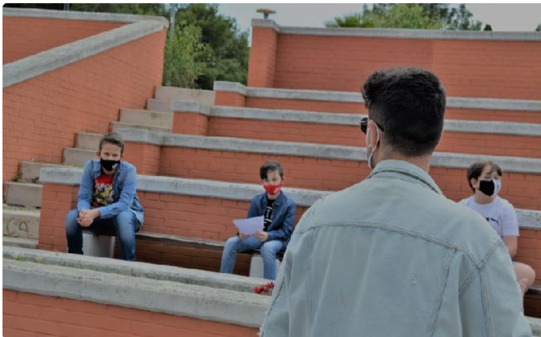
Attività “Rappo dunque sono” nell’ambito del progetto Foggiachildren, giugno 2020