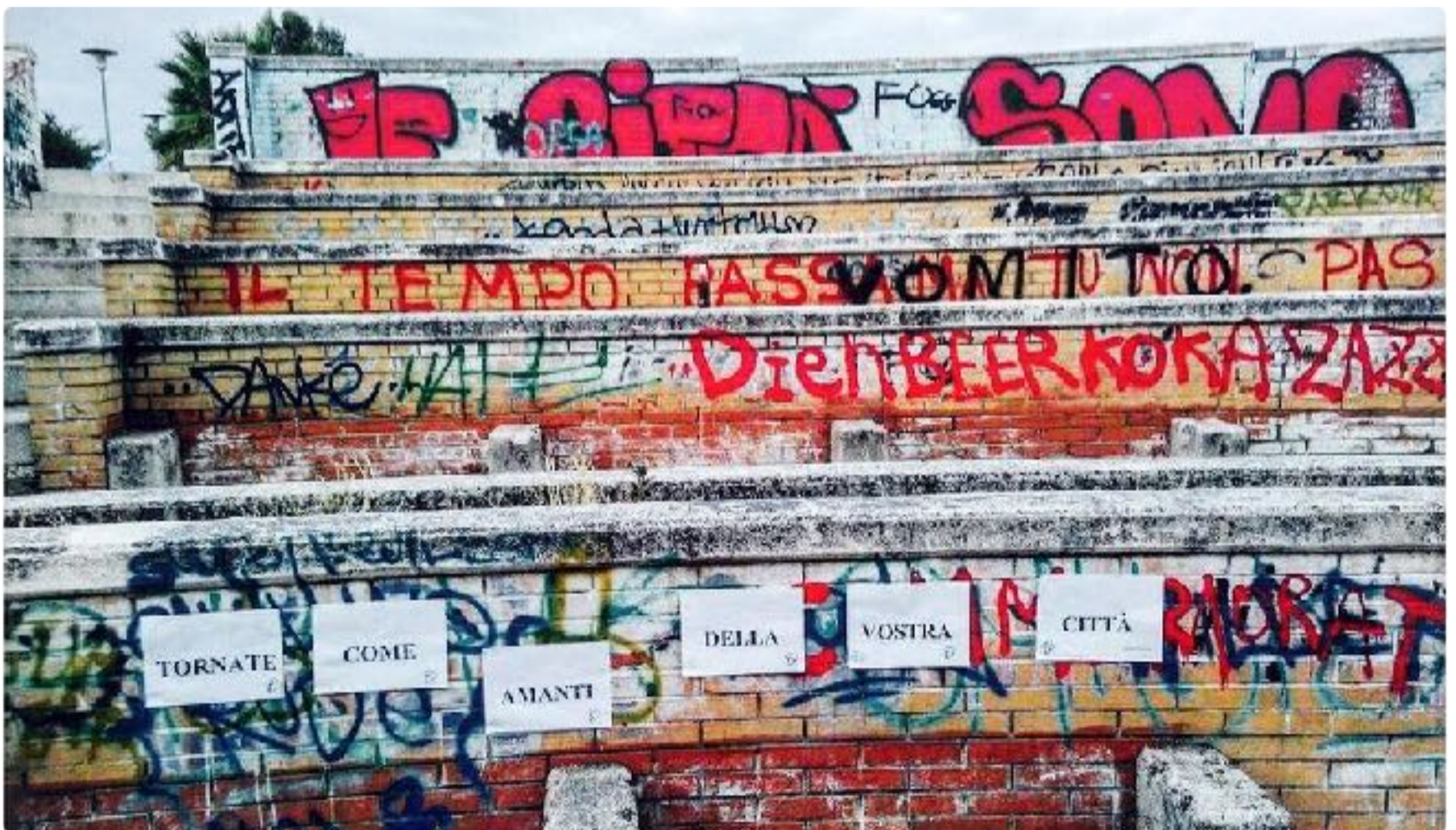
Messaggio di sensibilizzazione prima dei lavori di riqualificazione, estate 2015

A Parcocittà si è ricreato un pezzo importante di cittadinanza attiva, fatta di energie vitali e propositive che rappresentano il cuore pulsante di una comunità che guarda al futuro e che, grazie a quest'esperienza, si è alimentata di nuova linfa con una meravigliosa ondata di idee seguite da un florilegio di iniziative.