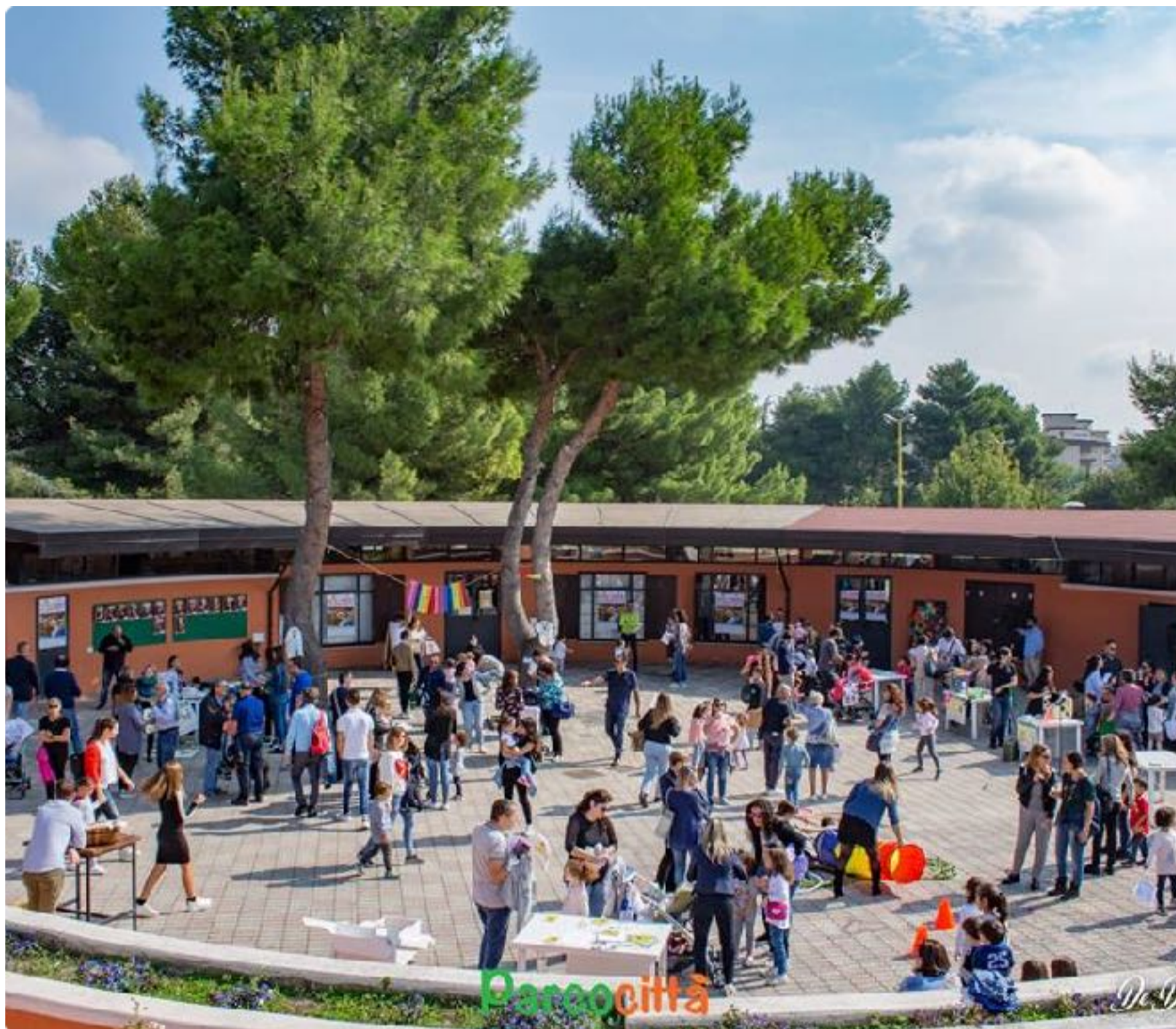
Festa di quartiere con bambini e famiglie utenti del progetto "L'isola che c'è", 14 ottobre 2018

Applicando il concetto di sussidiarietà orizzontale un gruppo di associazioni decide di rispondere ad un bisogno collettivo, prendersi cura di un pezzo della città di Foggia, maltrattato, abbandonato, ma sempre amato, Parco San Felice, un grande parco urbano confinante con quartieri popolari, che per anni è stato lasciato al degrado e alla degenerazione urbana, infondendo nei cittadini foggiani un senso di sfiducia e malessere. Come in tutti i luoghi di degrado, dove regnano il brutto e il disordine si sono aggiunti negli anni atti vandalici, criminalità e comportamenti anti – sociali.