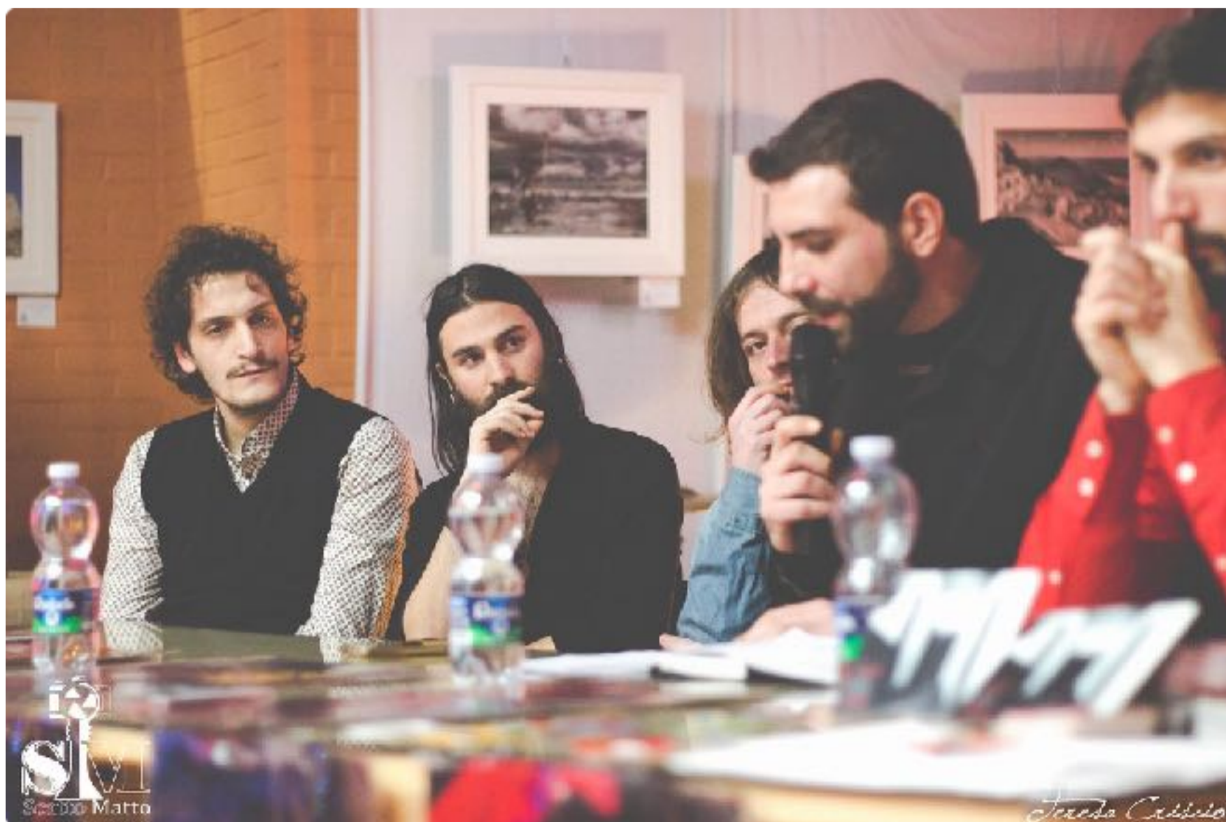
Presentazione videoclip musicale della band foggiana emergente "Il Giunto di Cardano", 2017