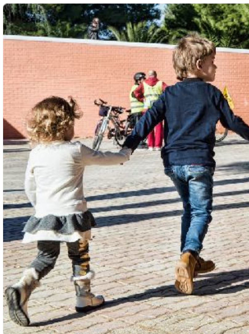
La comunità di Parcocittà: 0-99 anni.