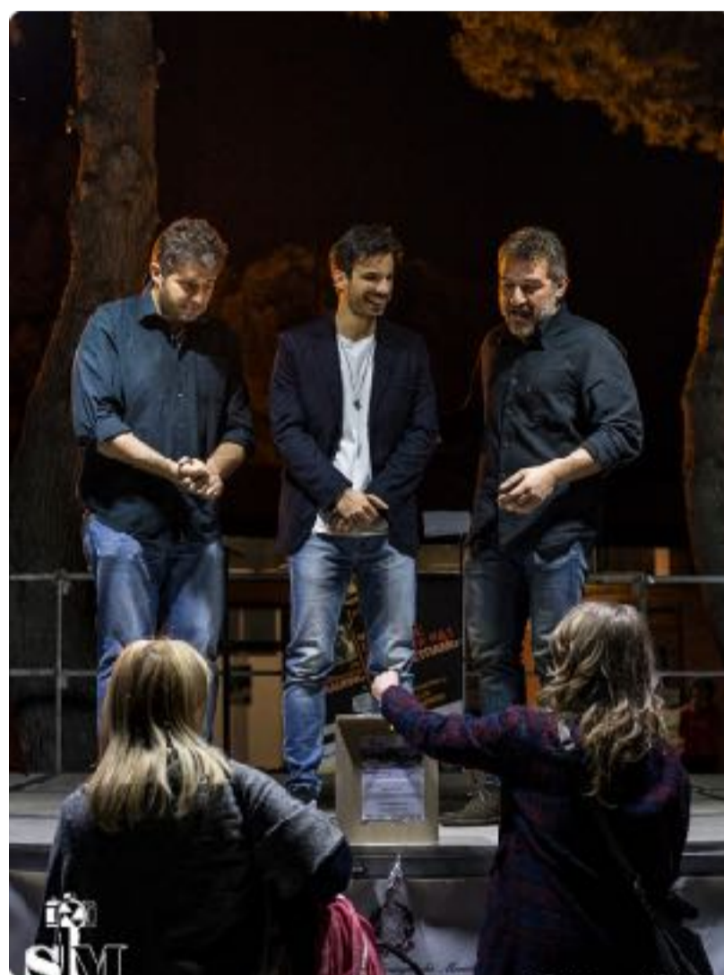
Evento teatrale nell'ambito della raccolta fondi "Luci su Parcocittà", 14 aprile 2017

Da ultimi, ma non per importanza, lo straordinario affetto e la meravigliosa attenzione che Parcocietà ha saputo creare intorno a sé. In cinque mesi di "campagna" sono stati raccolti 16.974 euro, qualcosa in più dell'obiettivo; più di 400 i donatori, dei quali oltre 20 tra associazioni, istituti scolastici e imprese locali; due testimonial d'eccezione, gli attori Michele Placido e Gianmarco Saurino, che, intercettati dagli operatori di Parcocietà, hanno prestato, in maniera totalmente amichevole e gratuita, volto e bravura in video-clip ed iniziative promozionali, tra cui uno spettacolo teatrale "a cappello" insieme agli attori degli