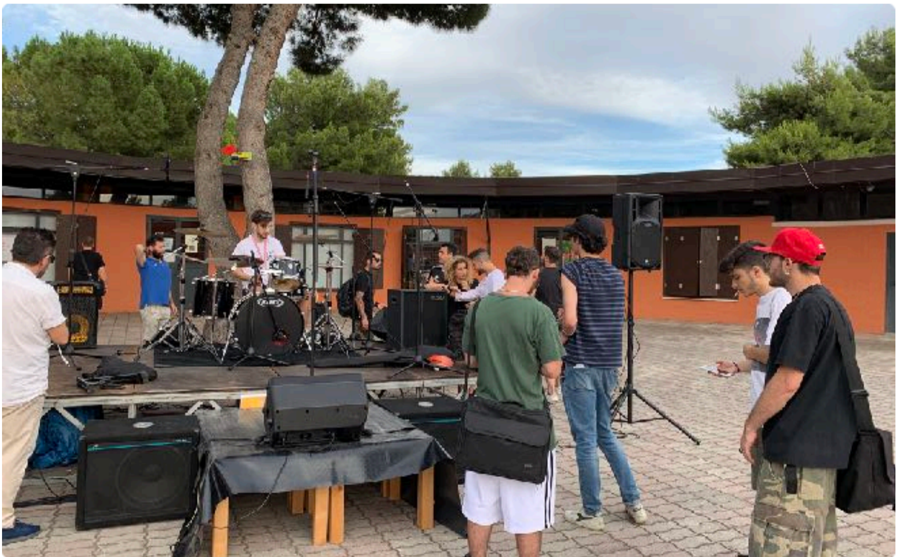
Allestimento palco per evento musicale di sensibilizzazione sulle fragilità giovanili "Non può finire mai" I ed., 1 agosto 2017

Prezioso è stato il contributo offerto dai volontari di Parcocittà in questi cinque anni per la crescita della struttura e il proliferare di idee e progetti. Sono giovani e adulti che hanno le facce di chi ha scelto di restare nella propria città per parlare di cultura, legalità e partecipazione e che non si rassegnano al fatto che si parli di Foggia solo per episodi di cronaca o degrado. Il concetto-chiave è stato quello di "appartenenza": sentirsi responsabili di un bene di cui beneficia la comunità e non soltanto alcune fasce di cittadini. Proprio per