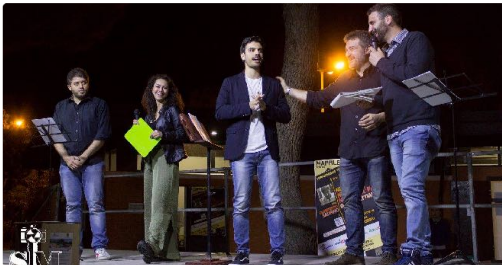
Evento in collaborazione con associazioni teatrali territoriali in occasione della raccolta fondi "Luci su Parcocittà", 2017

Le associazioni che hanno attuato il progetto hanno sempre creduto che le reti contano e sono fondamentali per conseguire obiettivi che singolarmente ogni associazione singola non sarebbe in grado di raggiungere. Ecco perché il valore aggiunto del progetto Parcocittà, rispetto a tutti i tentativi mancati che precedentemente si sono susseguiti, è stato solo e soltanto uno: il capitale umano .