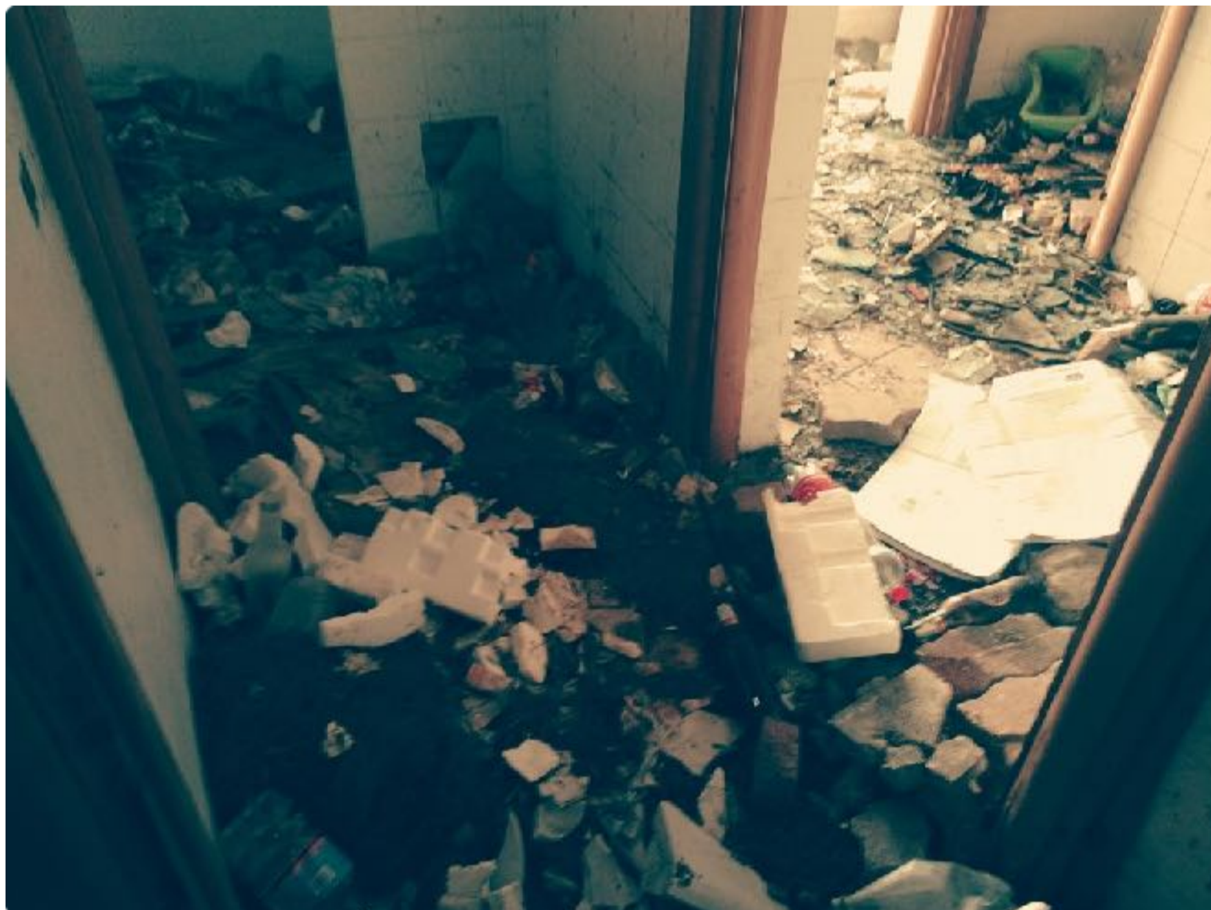
Stato della struttura antecedente la riqualificazione

“L'inferno dei viventi non è qualcosa che sarà; se ce n'è uno, è quello che è già qui, l'inferno che abitiamo tutti i giorni, che formiamo stando insieme. Due modi ci sono per non soffrirne.