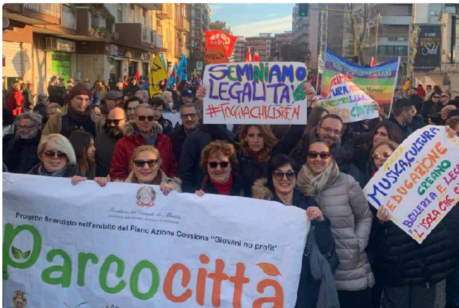
Foggia Libera Foggia - mobilitazione contro la violenza mafiosa, 10 gennaio 2020